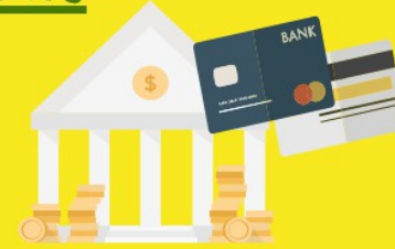
Banques, monnaie, financement