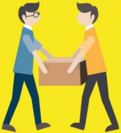
Lien social, solidarité